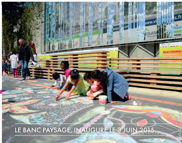
LE BANC PAYSAGE, INAUGURÉ LE 3 JUIN 2015

Plus de 300 nouveaux logements diversifiés accueillent ainsi anciens et nouveaux habitants à Bezons. Le nouveau Bords de Seine c'est aussi 12 000 m 2 de bureaux supplémentaires et des commerces qui participent à la mixité urbaine du secteur. Le tout relié par des espaces publics paysagers de qualité, repensés pour l'usage de tous.