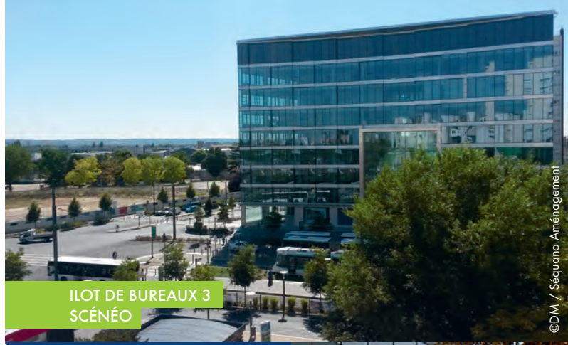
ILOT DE BUREAUX 3 SCÉNÉO

2011 2012 2013 2014 2015 2016 2017 2018 2019