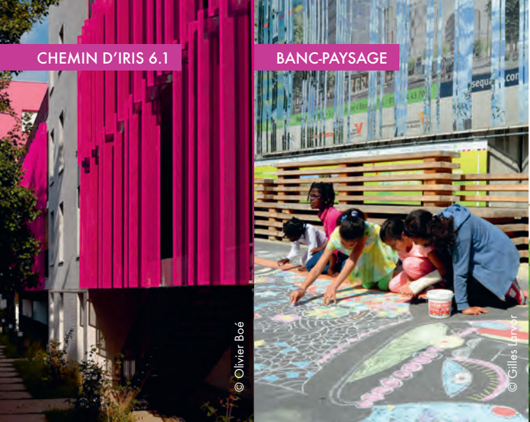
CHEMIN D'IRIS 6.1