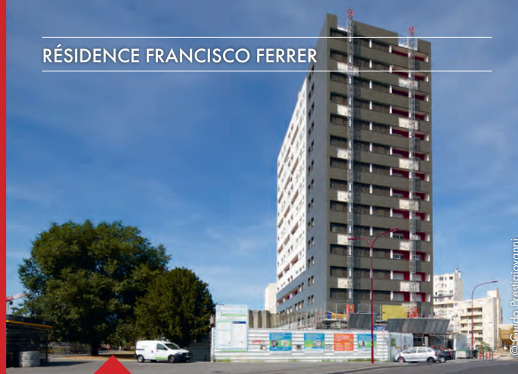
RÉSIDENCE FRANCISCO FERRER

Suite à l'ouverture place de la Grâce de Dieu du nouvel Hôtel de Ville le 31 octobre 2015, le chantier de démolition des anciens bâtiments a démarré début avril et s'est achevé fin juillet 2016. Les études préalables à la réalisation de nouveaux logements et d'un nouveau square sont en cours.