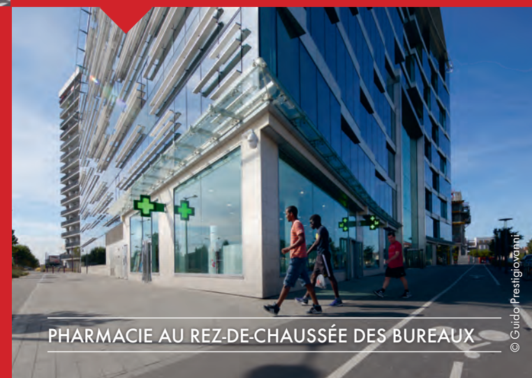
PHARMACIE AU REZ-DE-CHAUSSÉE DES BUREAUX

Le chantier se terminera à l'automne 2016 avec l'achèvement des façades extérieures. Il aura permis une rénovation complète du bâtiment : intérieur des logements, isolation de l'enveloppe, parties communes, accès et espaces extérieurs. La résidence Francisco Ferrer sera désormais embelli, plus sécurisée et répondra à des normes environnementales élevées (bâtiment basse consommation).