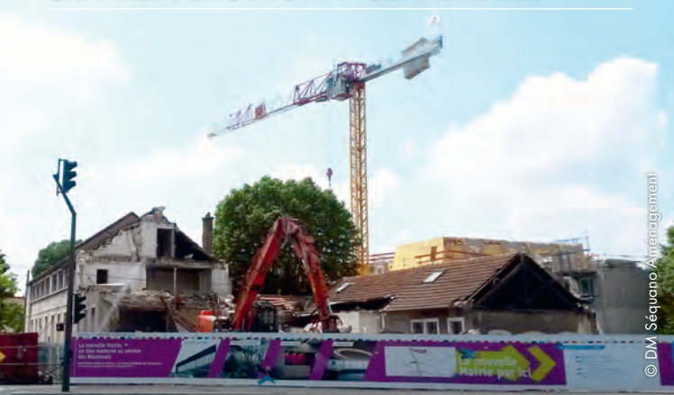
CHANTIER DÉMOLITION ANCIENNE MAIRIE

La pharmacie et le point chaud « la mie câline » situés en face du terminus du tramway, au rez-de-chaussée de l'immeuble Scénéo, sont ouverts depuis quelques mois. Il faudra attendre la fin du chantier et la livraison des logements 4.3/4.4 pour voir le restaurant ouvrir ses portes fin 2017.