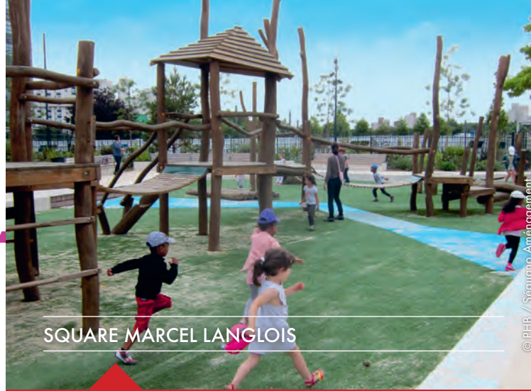
SQUARE MARCEL LANGLOIS

Cette année encore, chantiers et livraisons accompagnés d'espaces publics paysagers transforment les Bords de Seine. La reconquête du fleuve et de ses berges se concrétise par l'inauguration du mail et du square Langlois en décembre 2015, ainsi que par la livraison de la seconde phase du parc Nelson Mandela et de la nouvelle RD311 en juin dernier. Ces espaces ouverts à tous matérialisent l'objectif de création d'un cadre de vie embelli et vecteur d'animations.