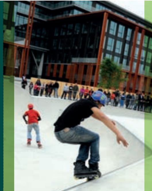
Aire de glisse

La centaine d'essences d'arbres, d'arbustes et de plantes installées dans ce parc en font un refuge pour la biodiversité et favorisent son développement.