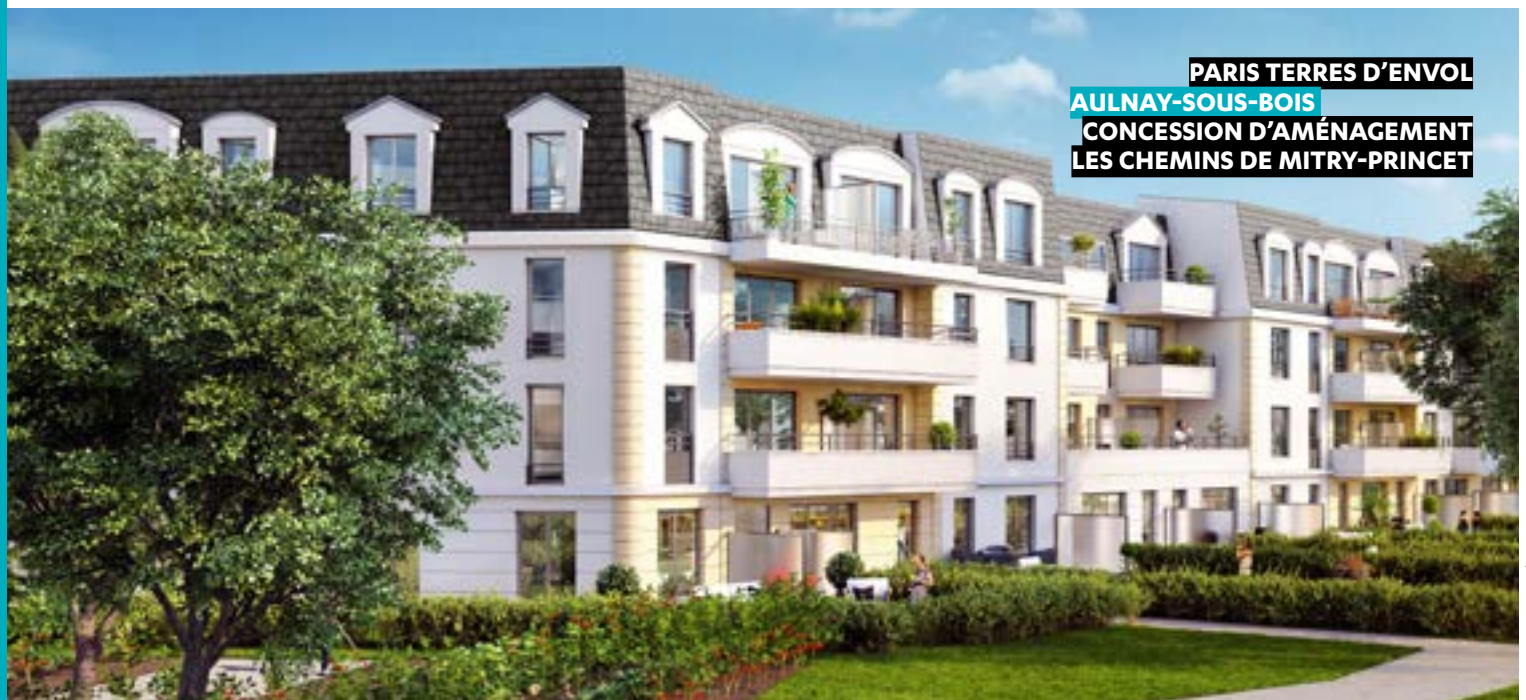
PARIS TERRES D'ENVOL AULNAY-SOUS-BOIS CONCESSION D'AMÉNAGEMENT LES CHEMINS DE MITRY-PRINCET