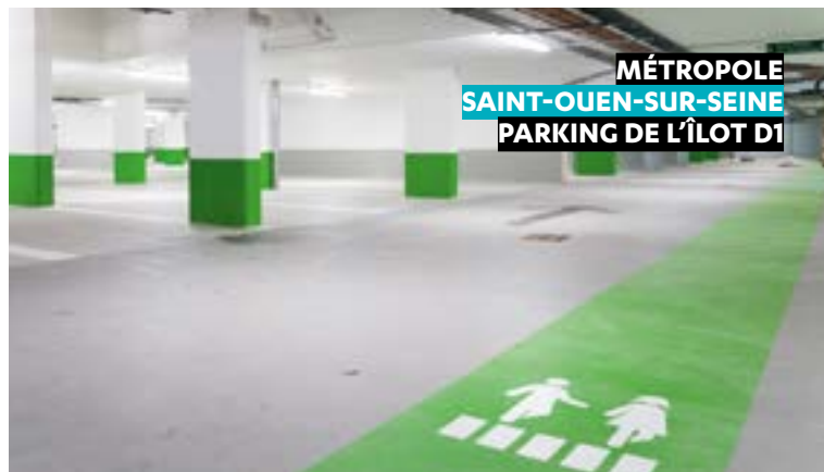
MÉTROPOLE SAINT-OUEN-SUR-SEINE PARKING DE L'ÎLOT D1