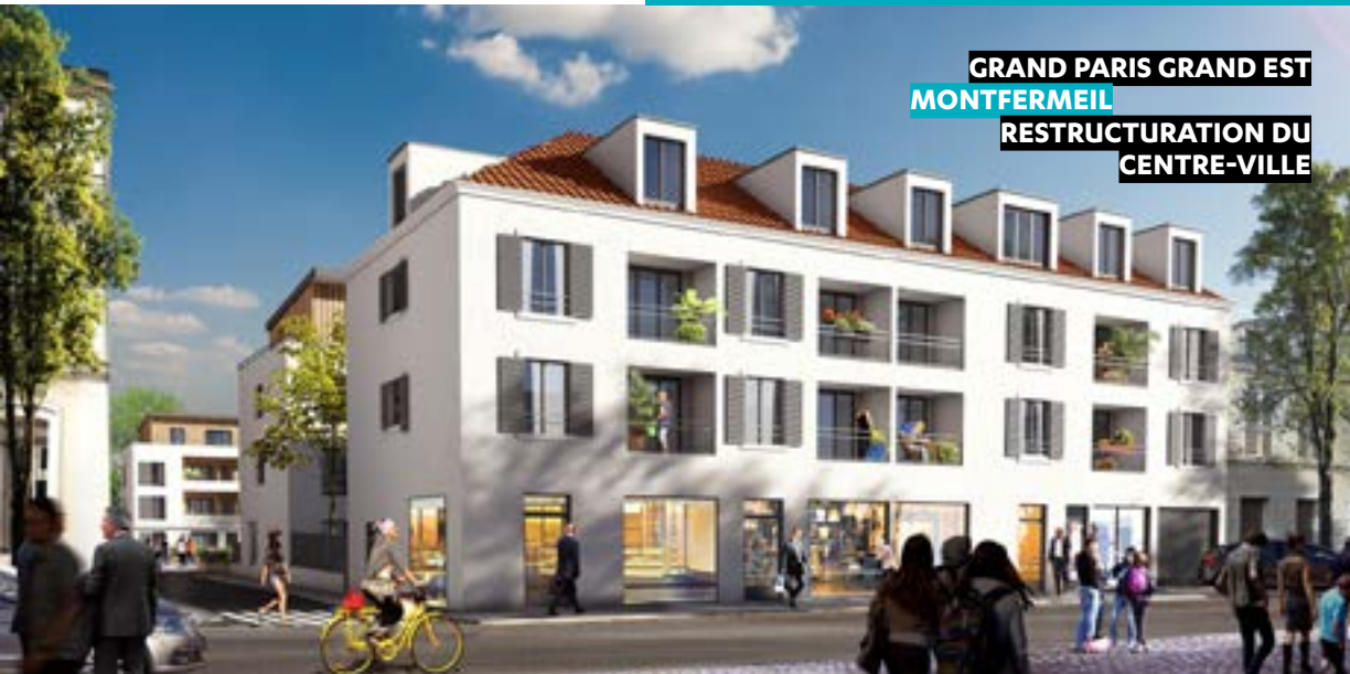
GRAND PARIS GRAND EST MONTFERMEIL RESTRUCTURATION DU CENTRE-VILLE

EN CHARGE DE LA CONCESSION D'AMÉNAGEMENT, Séquano a désormais la maîtrise foncière de l'opération et porte le projet de requalification du centre-ville de Montfermeil, dans le cadre du protocole entre la ville et l'Anru.