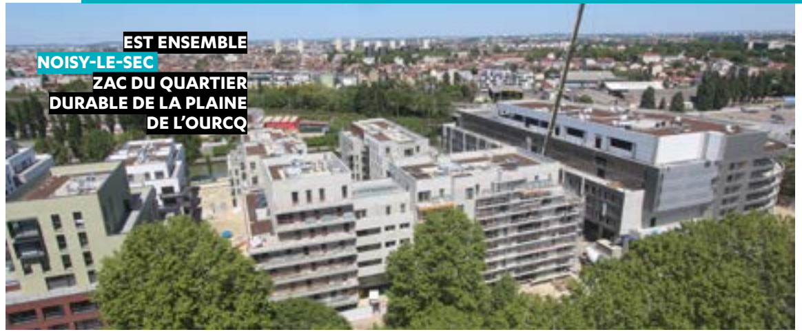
EST ENSEMBLE NOISY-LE-SEC ZAC DU QUARTIER DURABLE DE LA PLAINE DE L'OURCQ

LA ZAC DU QUARTIER DURABLE DE LA PLAINE DE L'OURCQ , couvrant environ 28 hectares, représente un enjeu important pour le devenir de Noisy-le-Sec. Elle s'ouvre sur le canal et permet le désenclavement de la cité de la Sablière. Au sein du secteur Engelhard, 618 logements, des commerces et un parking silo, seront livrés à partir de la rentrée 2019.