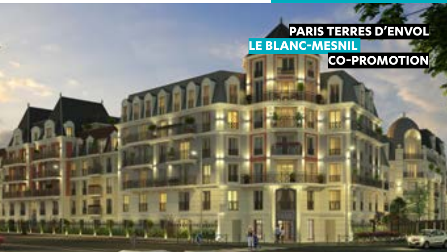
PARIS TERRES D'ENVOL LE BLANC-MESNIL CO-PROMOTION