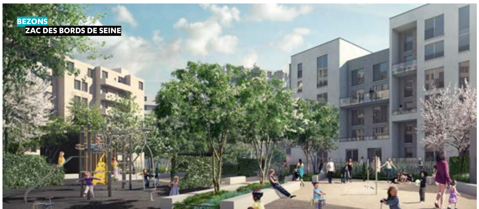
BEZONS ZAC DES BORDS DE SEINE