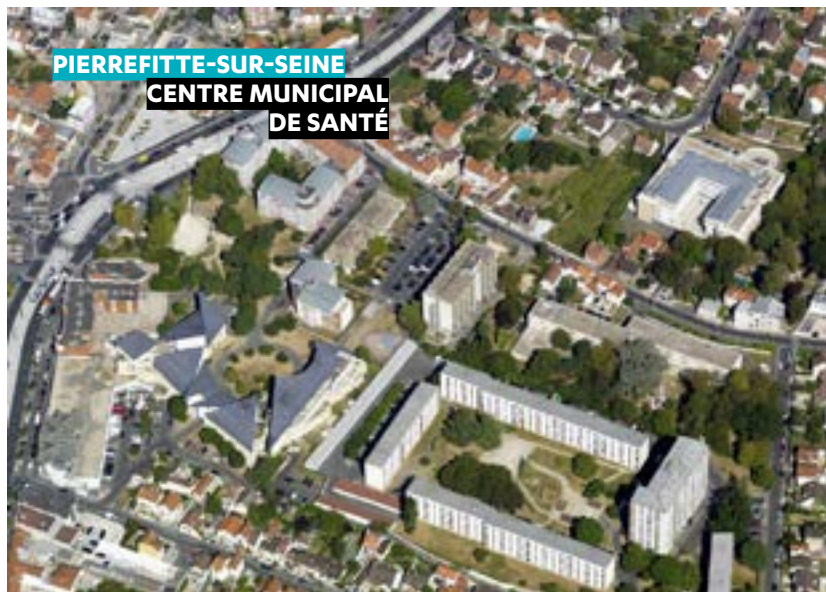
PIERREFITTE-SUR-SEINE CENTRE MUNICIPAL DE SANTÉ

est réalisée par Séquano pour le compte de la ville. Situé à proximité de l'Hôtel de ville, le CMS de Pierrefitte, au cœur d'un secteur en pleine mutation avec l'arrivée du tram, mérite aujourd'hui d'être rénové pour améliorer l'offre de services aux habitants.