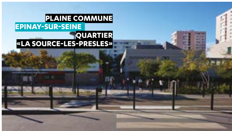
PLAINE COMMUNE EPINAY-SUR-SEINE QUARTIER «LA SOURCE-LES-PRESLES»

L'ÉTUDE PRÉ-OPÉRATIONNELLE D'AMÉNAGEMENT EN SECTEUR ANRU est réalisée par Séquano, dans le cadre d'un groupement, pour le compte de Plaine Commune et de la ville d'Epinay-sur-Seine. L'étude a pour objectif de conseiller les collectivités sur les modalités d'interventions juridiques et financières dans le cadre du protocole de préfiguration du nouveau programme national de renouvellement urbain (NPNRU) de Plaine Commune.