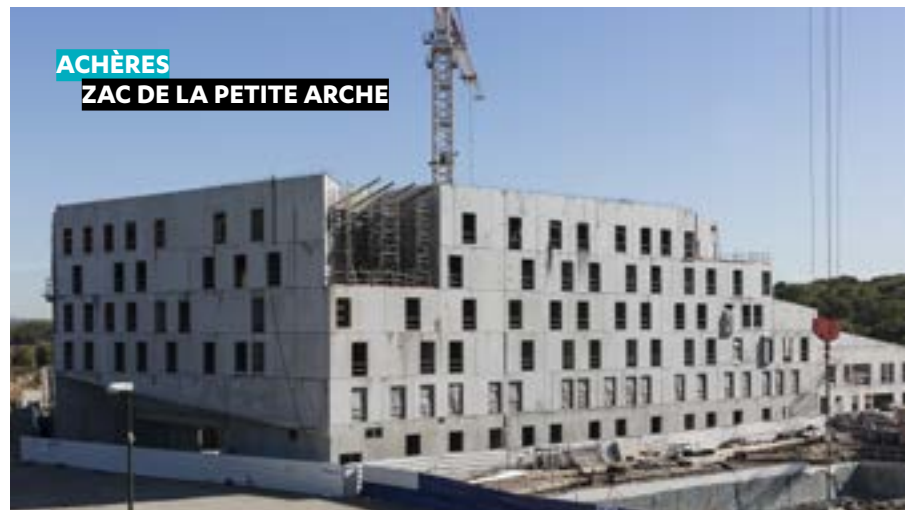
ACHÈRES ZAC DE LA PETITE ARCHE

AU SEIN DE LA ZAC DE LA PETITE ARCHE À ACHÈRES, les travaux de l'établissement de soins de suite et de réadaptation avancent à grand pas, pour une livraison et une mise en service de la clinique dans l'année.