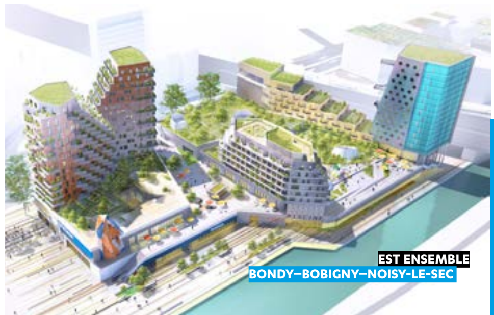
EST ENSEMBLE BONDY-BOBIGNY-NOISY-LE-SEC

Séquano accompagne l'EPT dans ce projet fédérateur : un hôtel, une résidence hôtelière, des logements, un nouveau Decathlon, des espaces de coworking et un mur d'escalade contribueront à créer un lieu attractif pour les villes de Noisy-le-Sec, Bondy et Bobigny.