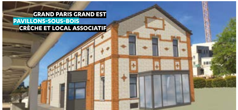
GRAND PARIS GRAND EST PAVILLONS-SOUS-BOIS CRÈCHE ET LOCAL ASSOCIATIF

SÉQUANO ET ADIM URBAN SONT LES MAÎTRES D'OUVRAGES de la construction du parking de l'îlot mixte D1, qui accueillera prochainement en sous-sol environ 800 places de stationnement, au sein de la Zac des Docks dans le secteur Bateliers-Nord à Saint-Ouen-sur-Seine. Les deux premiers niveaux de ce parking seront mis en service cet été, parallèlement à l'ouverture du Leroy Merlin.