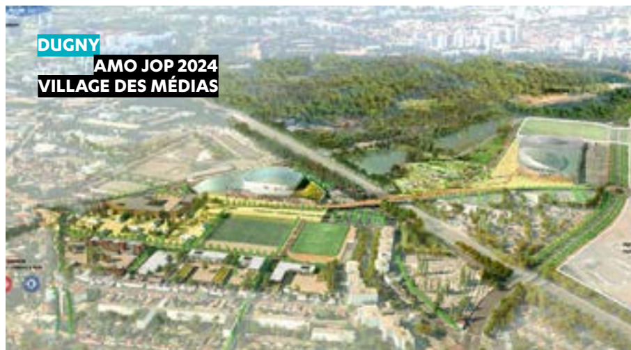
DUGNY AMO JOP 2024 VILLAGE DES MÉDIAS

ENGAGÉ POUR L'ORGANISATION DES JOP 2024 , le département de la Seine-Saint-Denis est accompagné par Séquano, en particulier pour la réussite du cluster des médias.