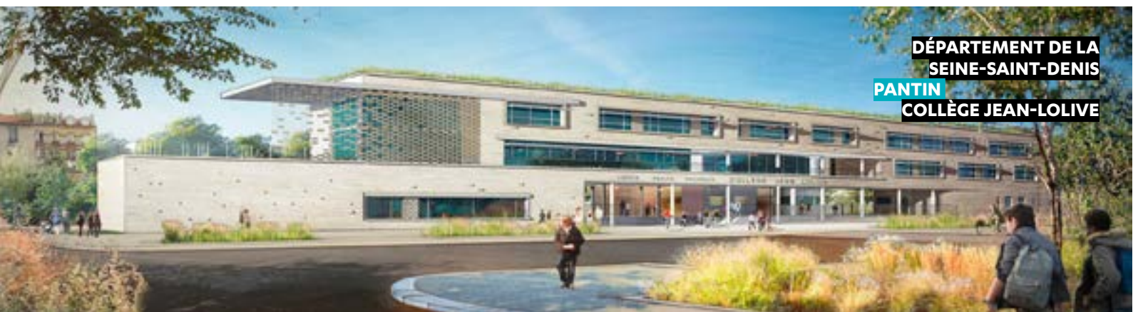
DÉPARTEMENT DE LA SEINE-SAINT-DENIS PANTIN COLLÈGE JEAN-LOLIVE

LE NOUVEAU COLLÈGE À PANTIN , dont le chantier a démarré en janvier 2019, accueillera 700 élèves. Séquano est mandataire pour le compte du département de la Seine-Saint-Denis. La livraison est prévue pour juin 2021.