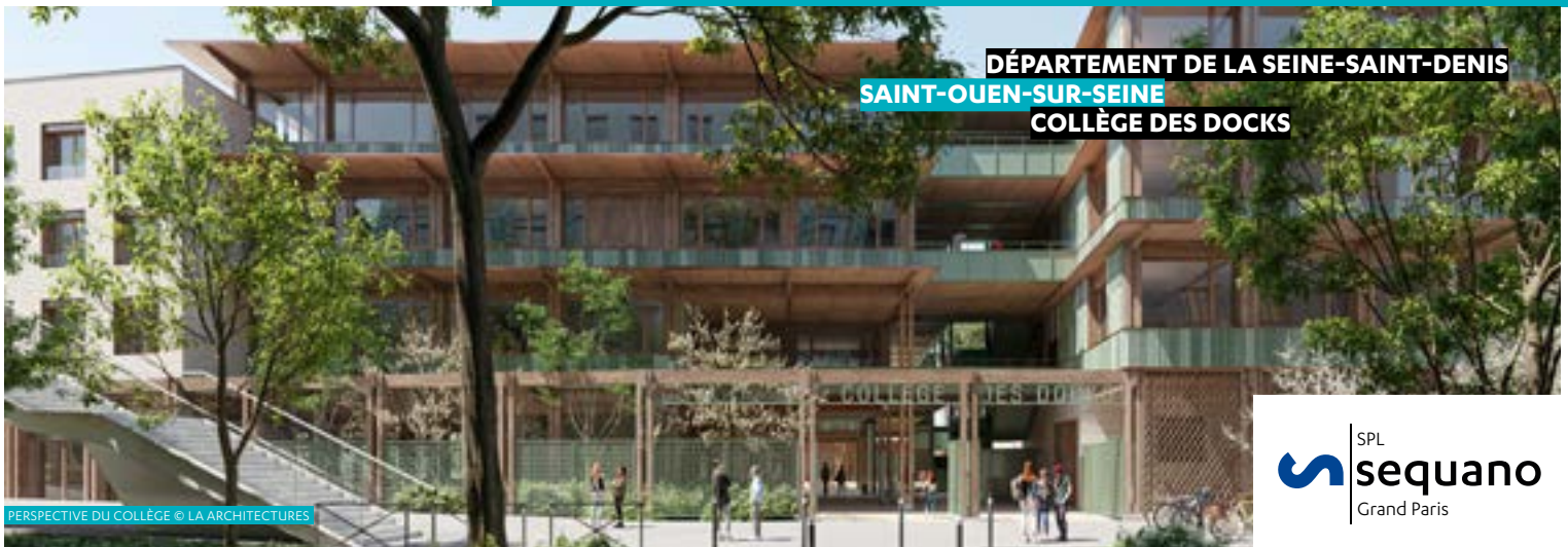
DÉPARTEMENT DE LA SEINE-SAINT-DENIS SAINT-OUEN-SUR-SEINE COLLÈGE DES DOCKS