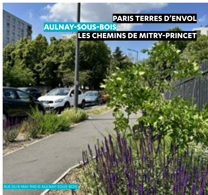
PARIS TERRES D'ENVOL

Séquano poursuit le réaménagement du secteur Mitry-Princet, en mettant en œuvre, dès novembre 2023, un vaste plan de requalification des rues du quartier. Végétalisation, circulations piétonnes et amélioration du stationnement constituent le cœur du projet.