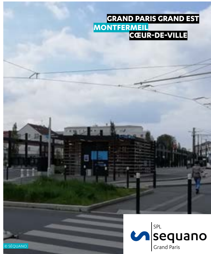
GRAND PARIS GRAND EST MONTFERMEIL CŒUR-DE-VILLE

La SPL Séquano Grand Paris et Alphaville ont présenté à la Métropole du Grand Paris et à la ville du Blanc-Mesnil les diagnostics et nouveaux éléments de programmation de ce qui a vocation à devenir en 2024 la nouvelle opération d'intérêt métropolitain de La Molette.