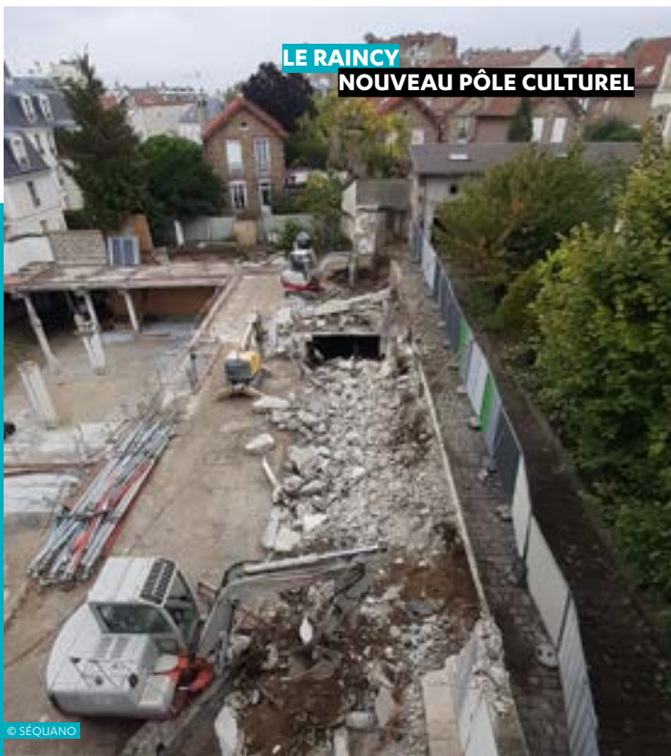
LE RAINCY NOUVEAU PÔLE CULTUREL

Le Département de la Seine-Saint-Denis a confié à la SPL Séquano Grand Paris la maîtrise d’ouvrage déléguée du futur 5 e collège de Saint-Ouen-sur-Seine. Le projet, conçu par LA Architectures, a été présenté aux habitants en mai 2023.