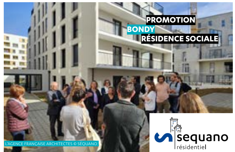
PROMOTION BONDY RÉSIDENCE SOCIALE

Les travaux de la résidence Aristide-Briand, réalisée dans le cadre d’une co-promotion Emerige résidentiel/ DGPAM/Séquano résidentiel, se poursuivent. La livraison de ce programme de 372 logements est prévue en 2025.