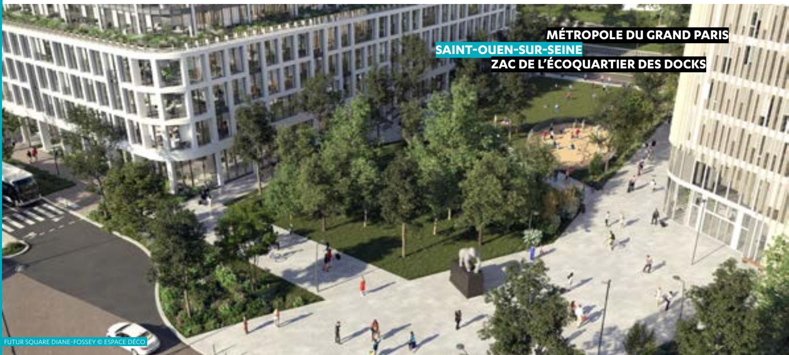
MÉTROPOLE DU GRAND PARIS SAINT-OUEN-SUR-SEINE ZAC DE L'ÉCOQUARTIER DES DOCKS

L'EPT Paris Terres d'envol vient de signer avec la SPL Séquano Grand Paris le traité de concession d'une durée de 16 ans, pour la mise en œuvre de l'opération d'aménagement NPNRU du quartier Anciennes-Beaudottes/Savigny. Le projet a commencé par de premières démolitions de tours, prélude à des opérations de réhabilitation et de reconstruction, ainsi qu'à la réalisation d'équipements et d'espaces publics généreux.