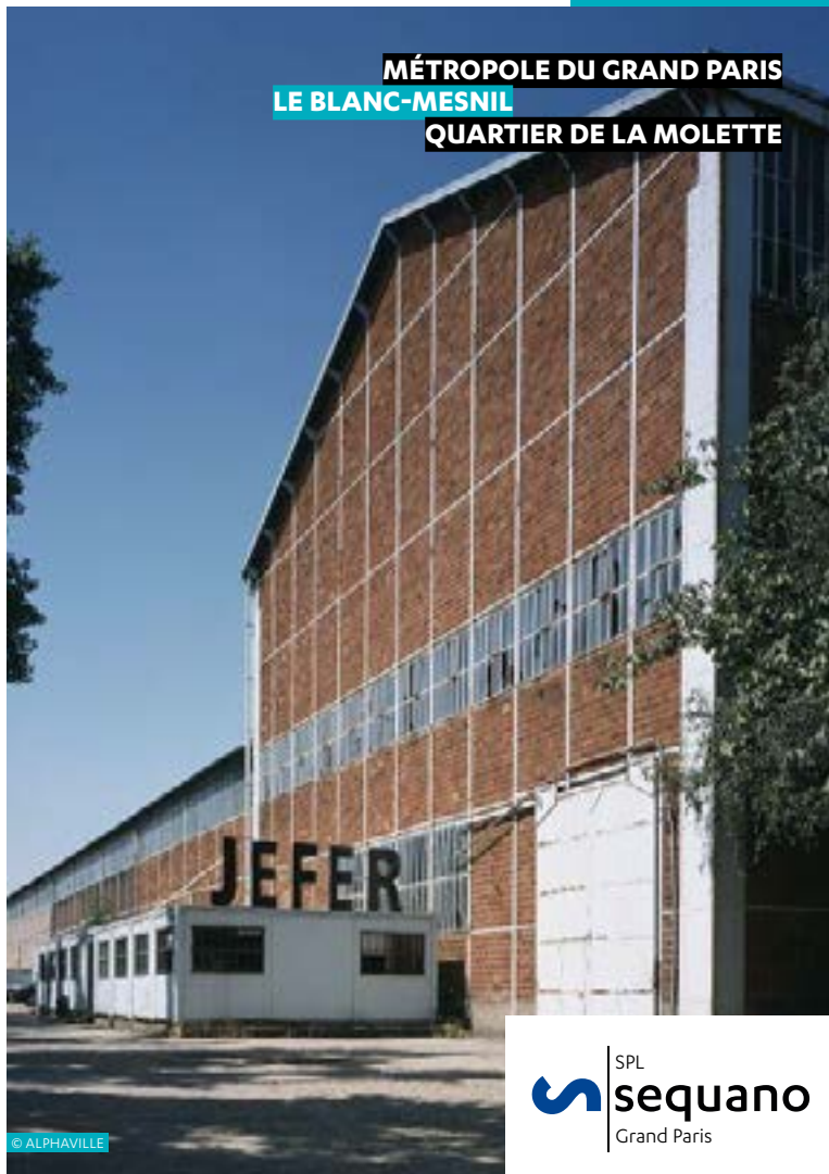
MÉTROPOLE DU GRAND PARIS LE BLANC-MESNIL QUARTIER DE LA MOLETTE