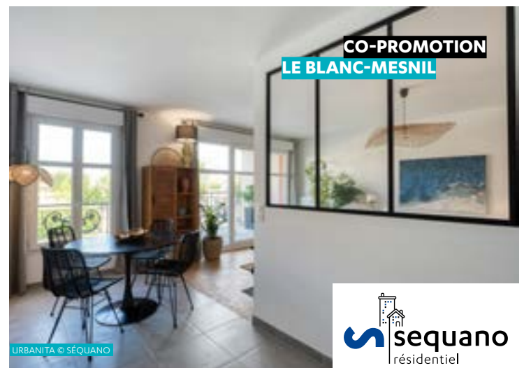
CO-PROMOTION LE BLANC-MESNIL

Les équipes de Séquano résidentiel ont présenté à leurs collègues le chantier de cette 2 e opération de promotion conduite par la filiale, avant la livraison à ICF Habitat-La Sablière prévue en novembre 2023 des 68 logements sociaux.