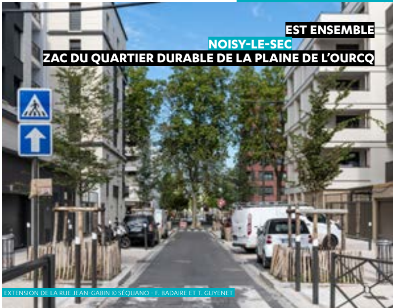
EST ENSEMBLE NOISY-LE-SEC ZAC DU QUARTIER DURABLE DE LA PLAINE DE L'OURCQ

EXTENSION DE LA RUE JEAN-GABIN