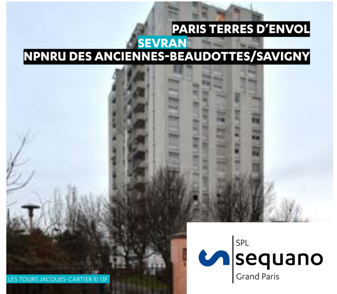
PARIS TERRES D'ENVOL SEVRAN NPNRU DES ANCIENNES-BEAUDOTTES/SAVIGNY

Séquano poursuit le désenclavement du quartier de La Sablière à Noisy-le-Sec. La rue Jean-Gabin, axe central du quartier, s'ouvre désormais vers la rue de Paris au nord et vers le centre-ville au sud. Les travaux d'espaces publics du quartier se poursuivent, pour accompagner les livraisons de nouvelles résidences.