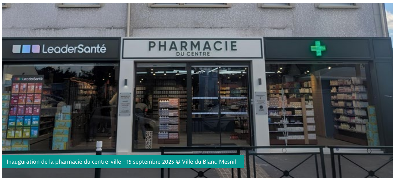
Inauguration de la pharmacie du centre-ville - 15 septembre 2025

Le 15 septembre 2025 a eu lieu l'inauguration de la nouvelle pharmacie du centre-ville. Le renouvellement de l'offre commerciale du centre-ville est au cœur des ambitions du projet de réaménagement du quartier.