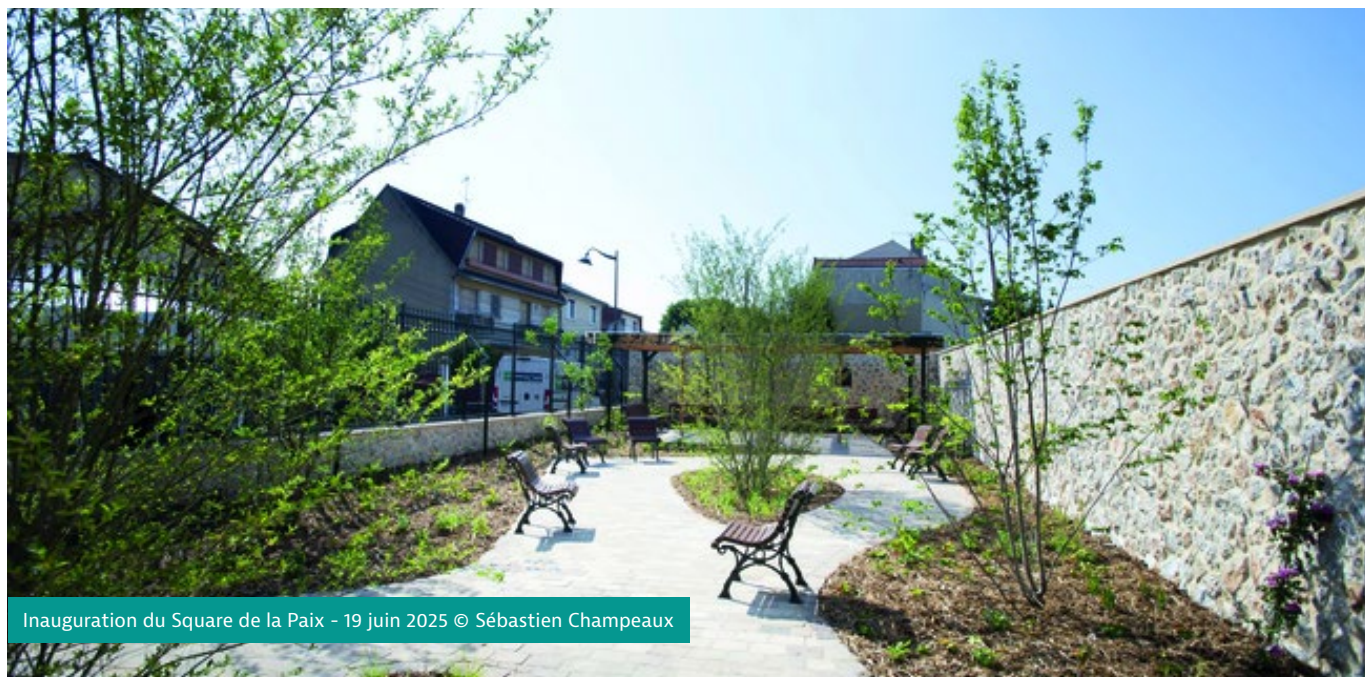
Inauguration du Square de la Paix - 19 juin 2025

Depuis son inauguration le 19 juin 2025, le Square de la Paix accueille petits et grands pour une pause en rentrant de l'école, en rentrant des courses ou bien tout simplement profiter des 300 m 2 d'espaces publics.